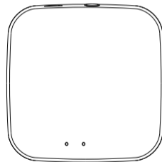
Центр управления умным домом Maytoni Smart Hub