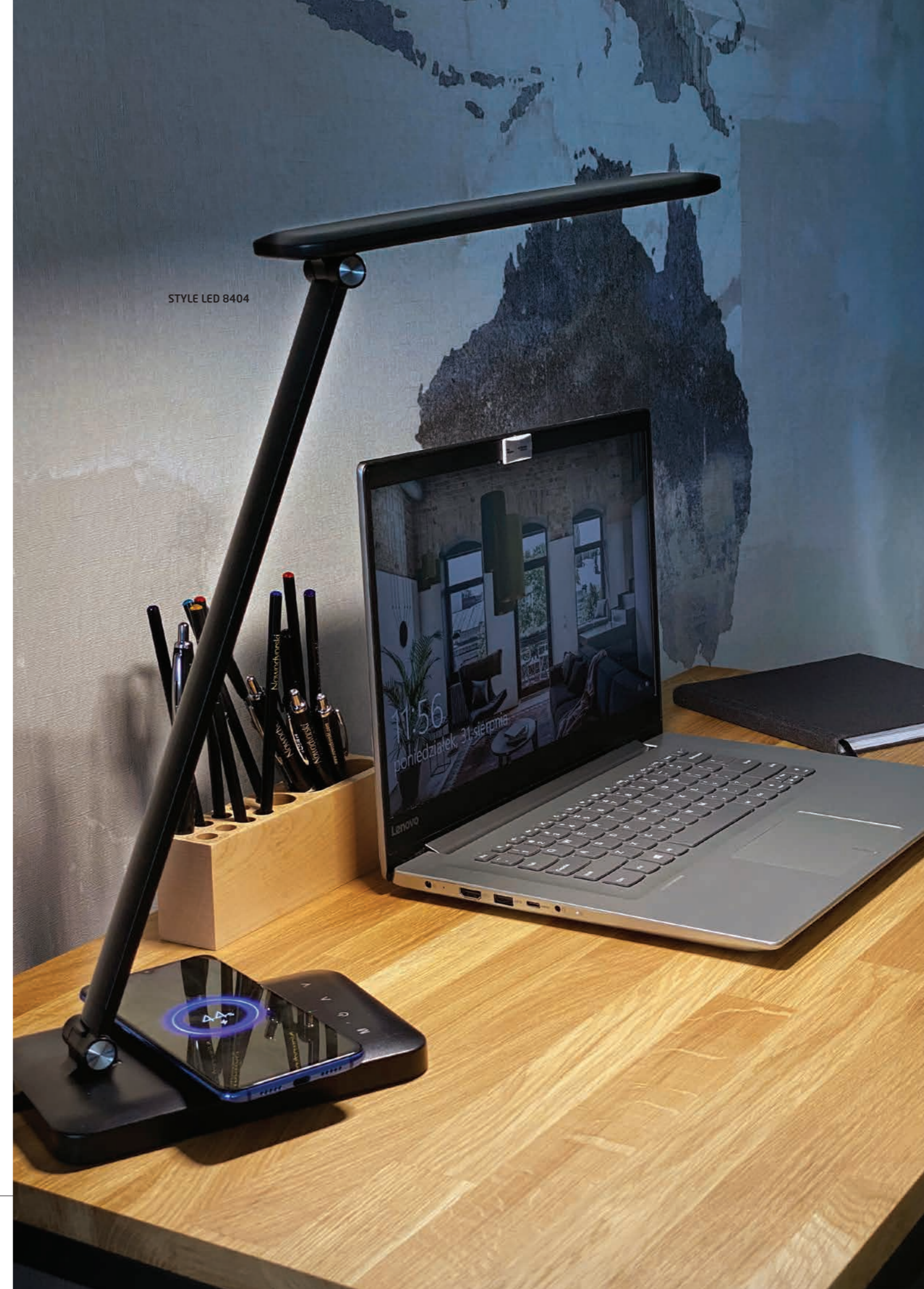
STYLE LED 8404