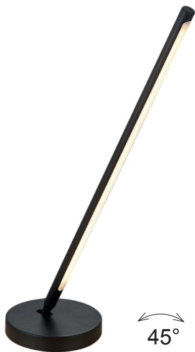
6737 Blanco Mate-Matt White LED 11W 3000K 900lm